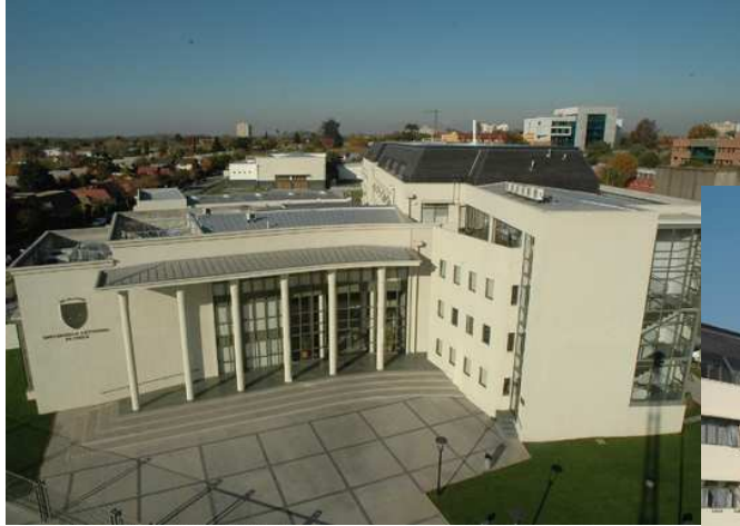
Vista frontal y posterior edificio principal Campus Talca